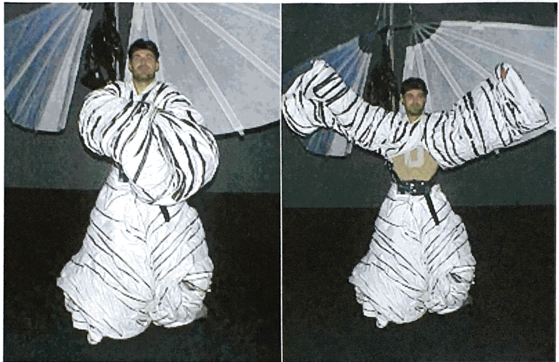
ArchiNed maakt zich op om de installatie te betreden

vijf fraaie pakken aantrekken waarin je even later het spel in de playground n aangaan. De kostuums zijn zo gemaakt dat ze de speler van een specifieke handicap voorzien. Elk pak beïnvloedt de bewegingsvrijheid op een andere manier door de materiaalkeuze, bijzondere afmetingen en gewicht. Later zal blijken dat het gebruik van dampdicht kunststof ook het uithoudingsvermogen van de spelers zal beïnvloeden.