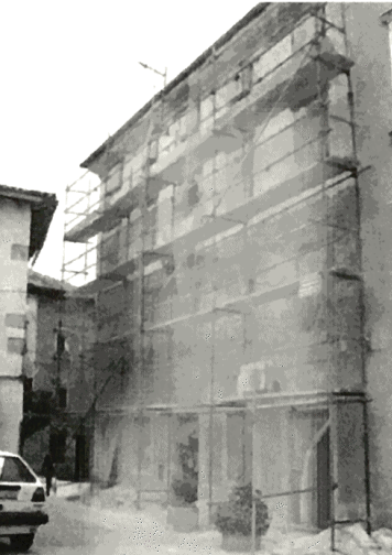
Zgrada preko puta palače u kojoj su prostorije vodnjanskog TZ-a bit će dotjerana idući tjedan