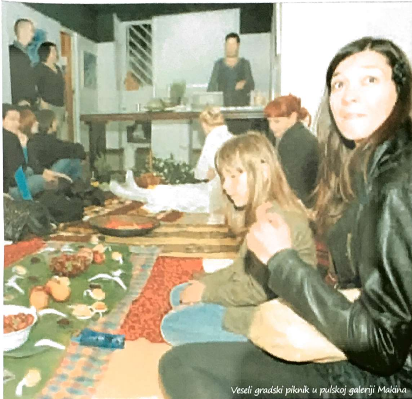
Veseli gradski piknik u pulsnoj galeriji Makina